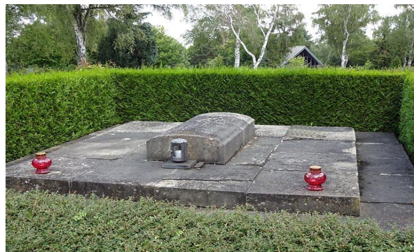
Letzte Ruhe auf dem Zülpicher Friedhof.