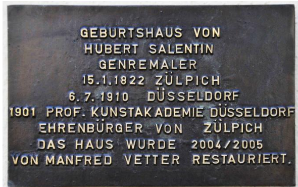
Gedenktafel am Geburtshaus