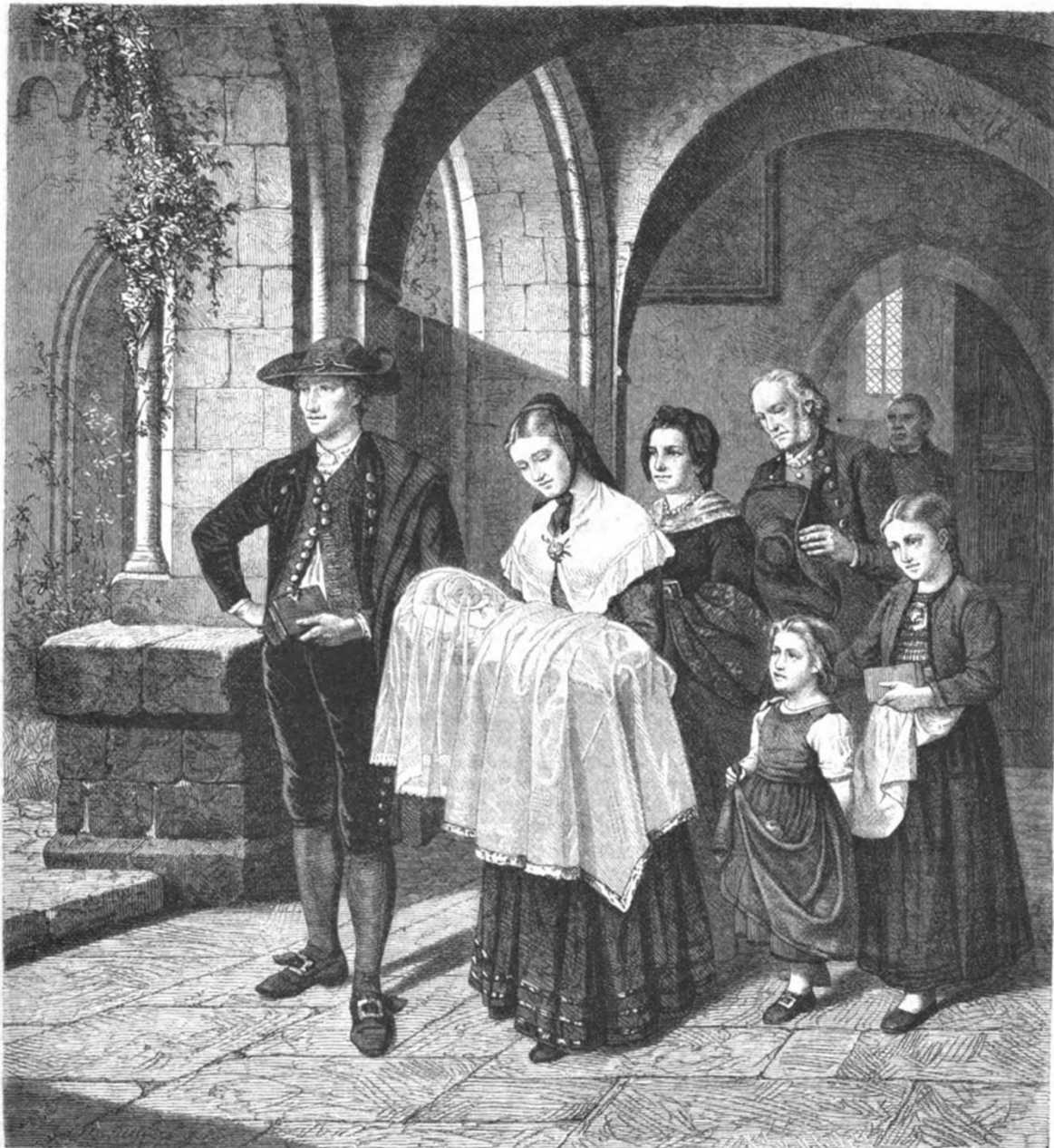
Rückkehr von der Taufe. Nach dem Gemälde von Hubert Salentin.

Rückkehr von der Taufe, Lithographie nach Gemälde von Hubert Salentin – gemeinfrei.