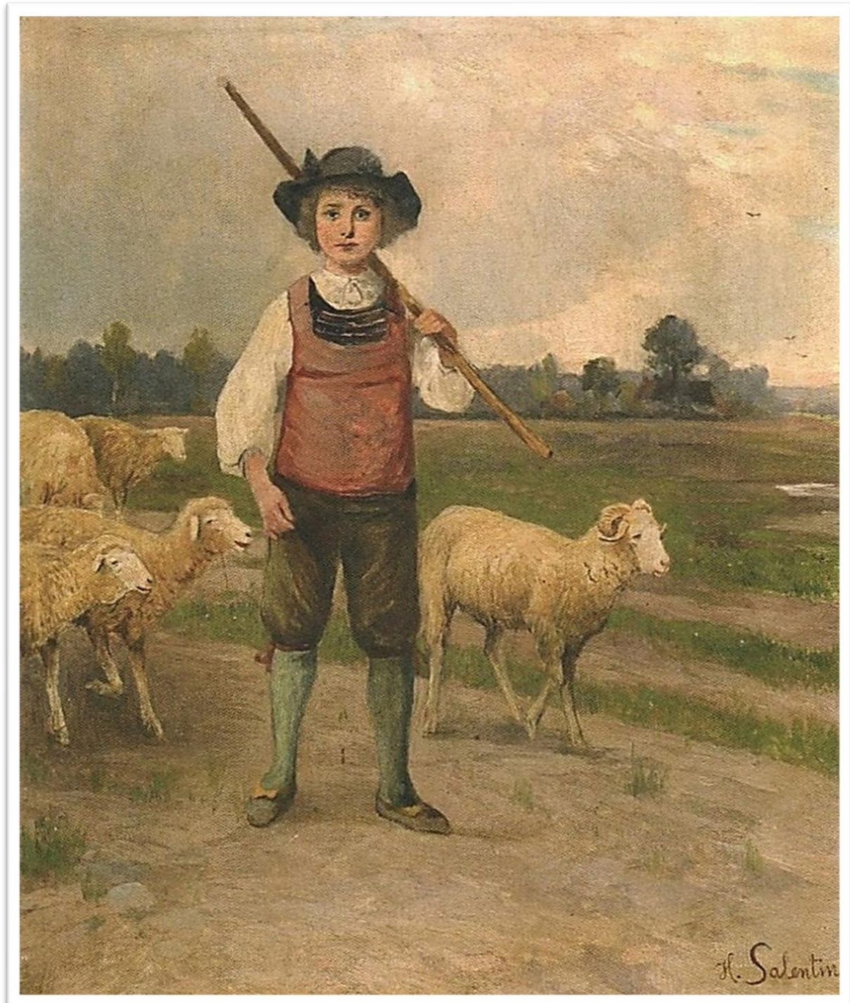
Der Hirtenjunge, 1910, Hubert Salentin – Auktionskatalog Van Ham, Mai, 2009.

Auf dem Grundstück Kölnstraße 2 in Zülpich entstand im Jahre 2024 u.a. das „ Hubert Salentin-Museum “. Der bestehende Altbau der 1930er Jahre wurde grundlegend saniert, umgebaut und um einen Anbau erweitert.