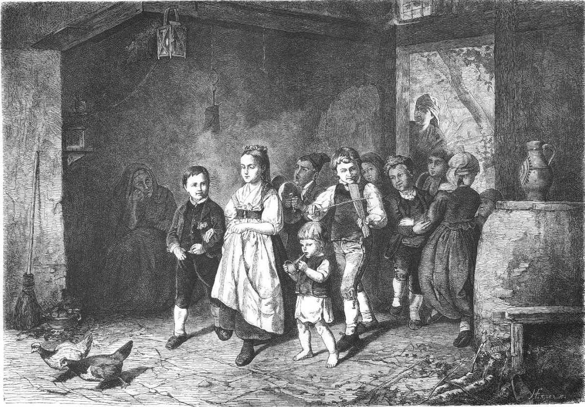
Die Gartenlaube, various, Lithographie nach Gemälde von Hubert Salentin – gemeinfrei.